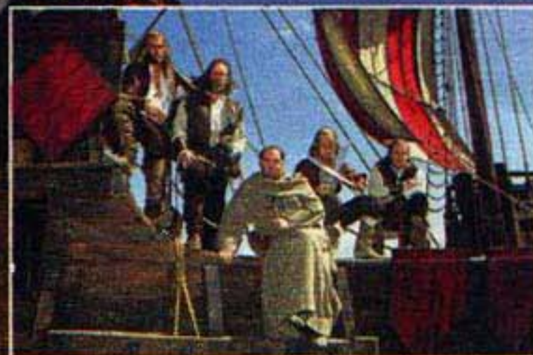
Die Kogge: eins zu eins nachgebaut