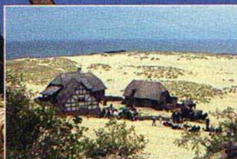
In den Dünen: Störtebekers Elternhaus