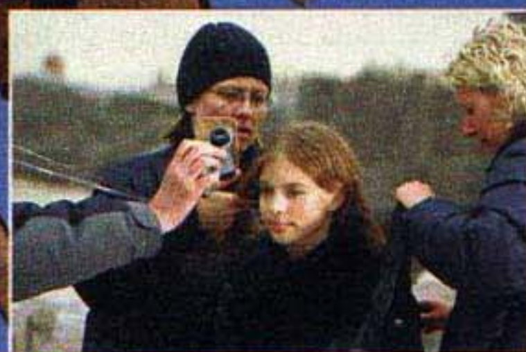
Am Set: die Französin Claire Keim